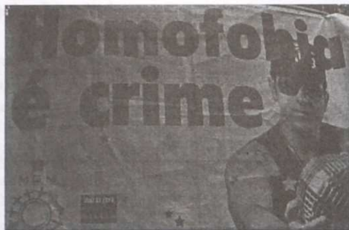
Detalhe do banner no Trio

O 1º Rainbow Fest de Cataguases trouxe à cidade uma grande quantidade de eventos, tendo como abertura no Instituto Francisca de Souza Peixoto uma série de palestras Jurídicas com temas atuais e interessantes como: Direitos GLBTs