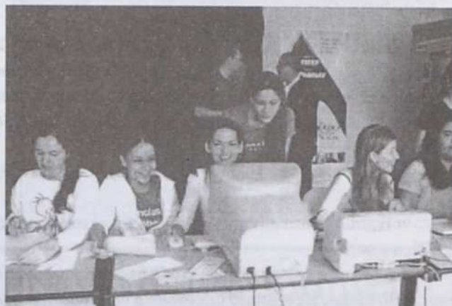
Alunos do curso de Ciências Contábeis

Inicialmente para medir o aumento dos rebanhos, posteriormente medindo os lucros no comércio, passou pelo rendimento dos transportes das caravelas, veio a industrialização, os grupos multinacionais e agora o comércio eletrônico. Não podemos esquecer das ONGS e dos Órgãos Governamentais. Com tantas mudanças de cenário a contabilidade adaptou-se e do simples método de partidas dobradas surgiram um gama de relatórios capazes de atender a vários usuários. Podendo ir do